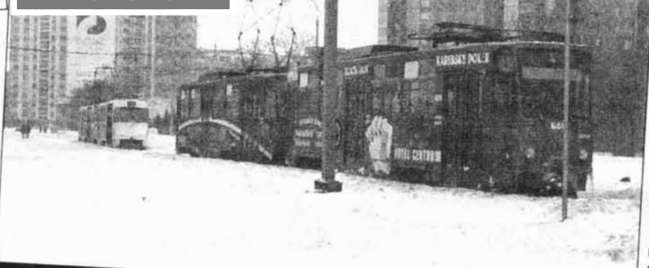
Košické električky včera premávali, ale čo bude dnes...