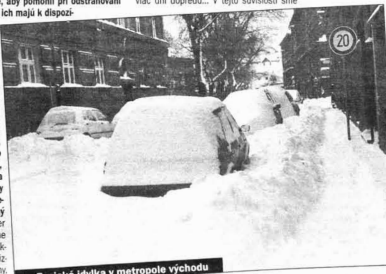
Typická idylka v metropole východu